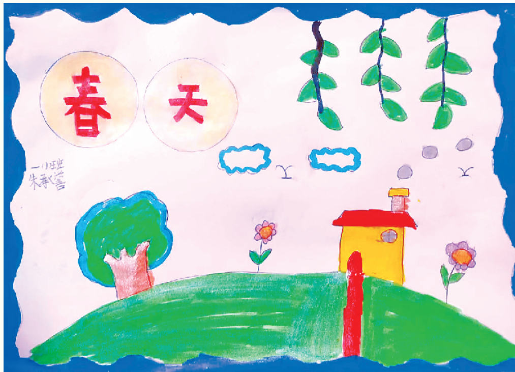
小记者：朱承誉 一(1)班 辅导老师：鹿凤珍